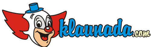
Zmiana koloru znaku