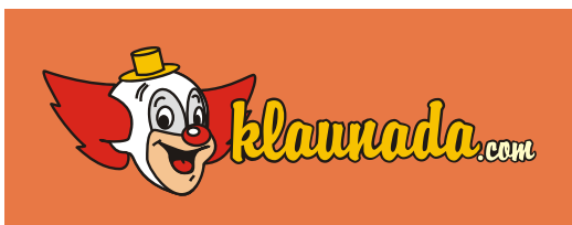
Umieszczanie znaku na agresywnym tle.