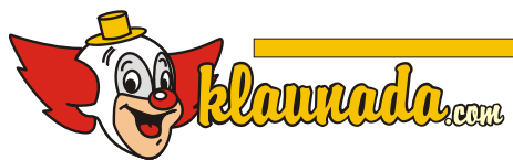
Umieszczanie innych elementów w polu ochronnym znaku