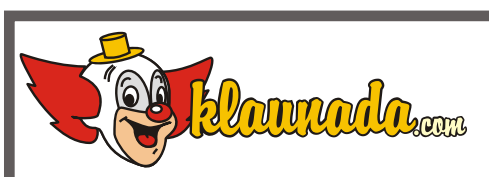
Umieszczanie znaku zbyt blisko krawędzi strony