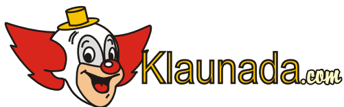
Zmmiana czcionek, ich wielkościoraz propocji na inne niż projektowane